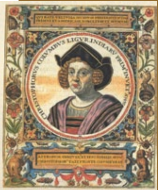
Retrato de Cristóbal Colón "America" de Teodoro de Bry, Francfort, 1590

Cuando Colón llega a Castilla en la primavera de 1485, además de una vasta experiencia marinera, es un hombre muy cultivado, conoce varias lenguas (italiano, portugués, latín y jerga levantisca), posee sobrados conocimientos cartográficos y se encuentra arropado por un apreciable caudal de lecturas de temática geográfica y cosmográfica que resultan imprescindibles para defender su plan de llegar a las Indias por occidente. La base de sus lecturas está en la Biblia, a la que acompañan la Geografía de Ptolomeo (Roma 1478), la Imago Mundi de Pierre d'Ally (Lovaina 1483), la ya mencionada Historia rerum ubique gestarum , de Eneas Silvio Piccolomini, Papa Pío II (Venecia 1477), la Historia Natural de Plinio (Venecia 1489), y el libro de los viajes de Marco Polo (Amberes 1485), entre otras.