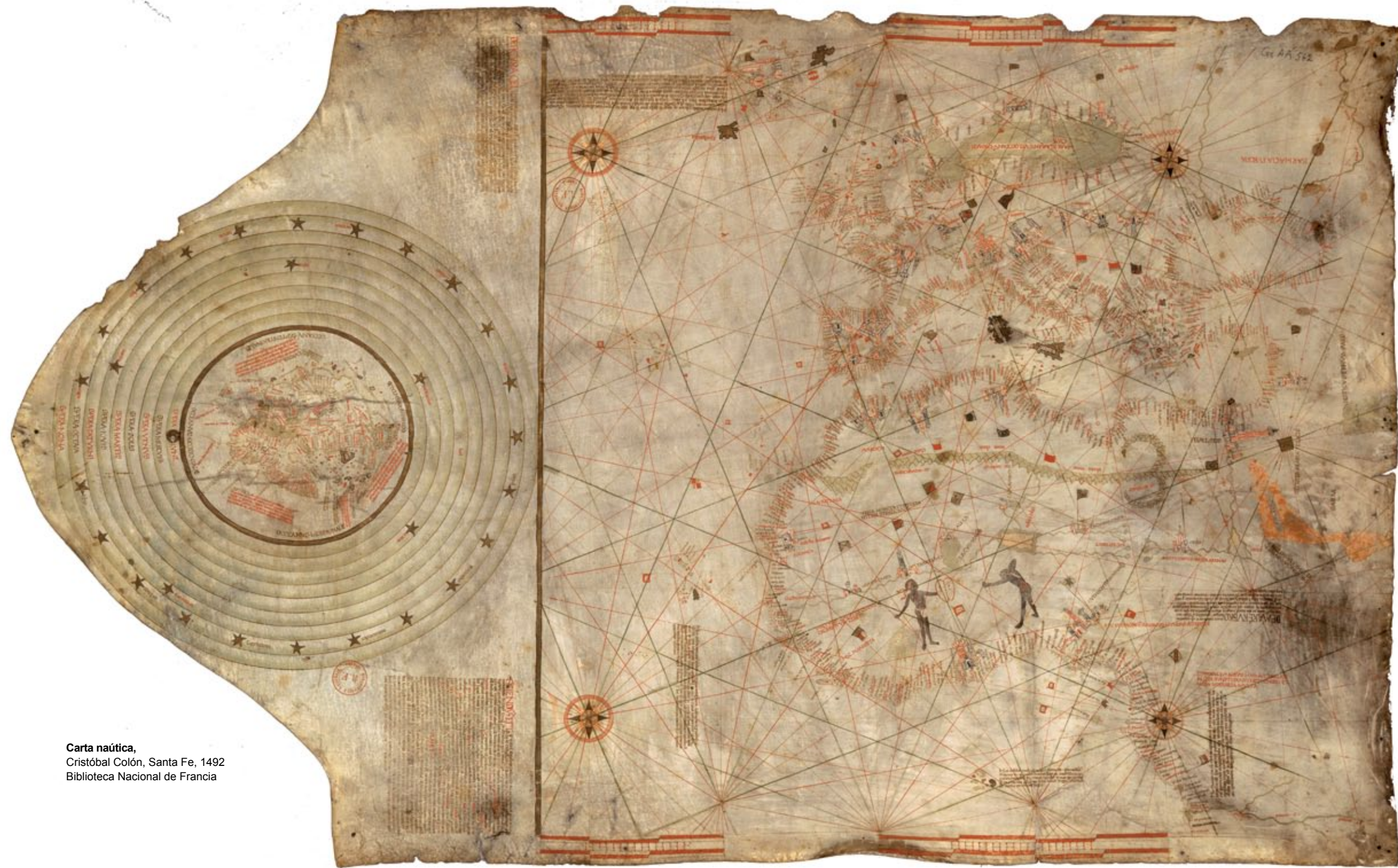
Carta náutica, Cristóbal Colón, Santa Fe, 1492 Biblioteca Nacional de Francia