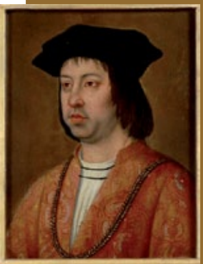
Fernando II de Aragón, Michel Sittow, 1491-92, Kunsthistorisches Museum, Viena

Ante el poco interés que los portugueses mostraron por el proyecto colombino, enfascados como estaban en afianzar sus rutas comerciales a las Indias rodeando África, Colón tuvo que abandonar la seguridad de su posición personal y laboral en Portugal y seguir a la peregrina corte de los Reyes Católicos durante siete años, para convencerlos de la viabilidad de su proyecto. Finalmente, el 17 de abril de 1492 se firmaron en el Real de Santa Fe, las Capitulaciones por las que los Reyes Católicos y Cristóbal Colón, emprendían el negocio del descubrimiento, abriendo una nueva ruta comercial que permitiría llegar a las especias y riquezas del extremo oriente, sin interferir en los tratados que se habían firmado con los vecinos lusos (Tratado de Alcáçovas-Toledo, 1479-80).