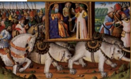
Libro de las maravillas del mundo, Marco Polo, 1410-12, Biblioteca Nacional de Francia