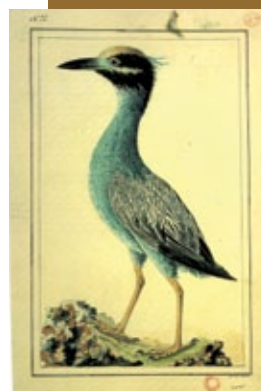
Garza martinete, José Cardero, 1789-1794, Lápis, tinta y acuarela sobre papel, Museo Naval, Madrid

tercios a un grado terrestre, si bien Colón no reparó en que Alfragano empleaba la milla árabe y no la itálica. Así, su impugnación de las medidas suministradas por Ptolomeo, le llevó a cometer una equivocación crucial en los cálculos para su proyectada empresa marítima que, así, se convirtió en «el éxito del error».