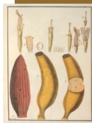
Plátano macho, Francisco Pulgar, 1789-94, Lápis, tinta y acuarela sobre papel, Museo Naval, Madrid