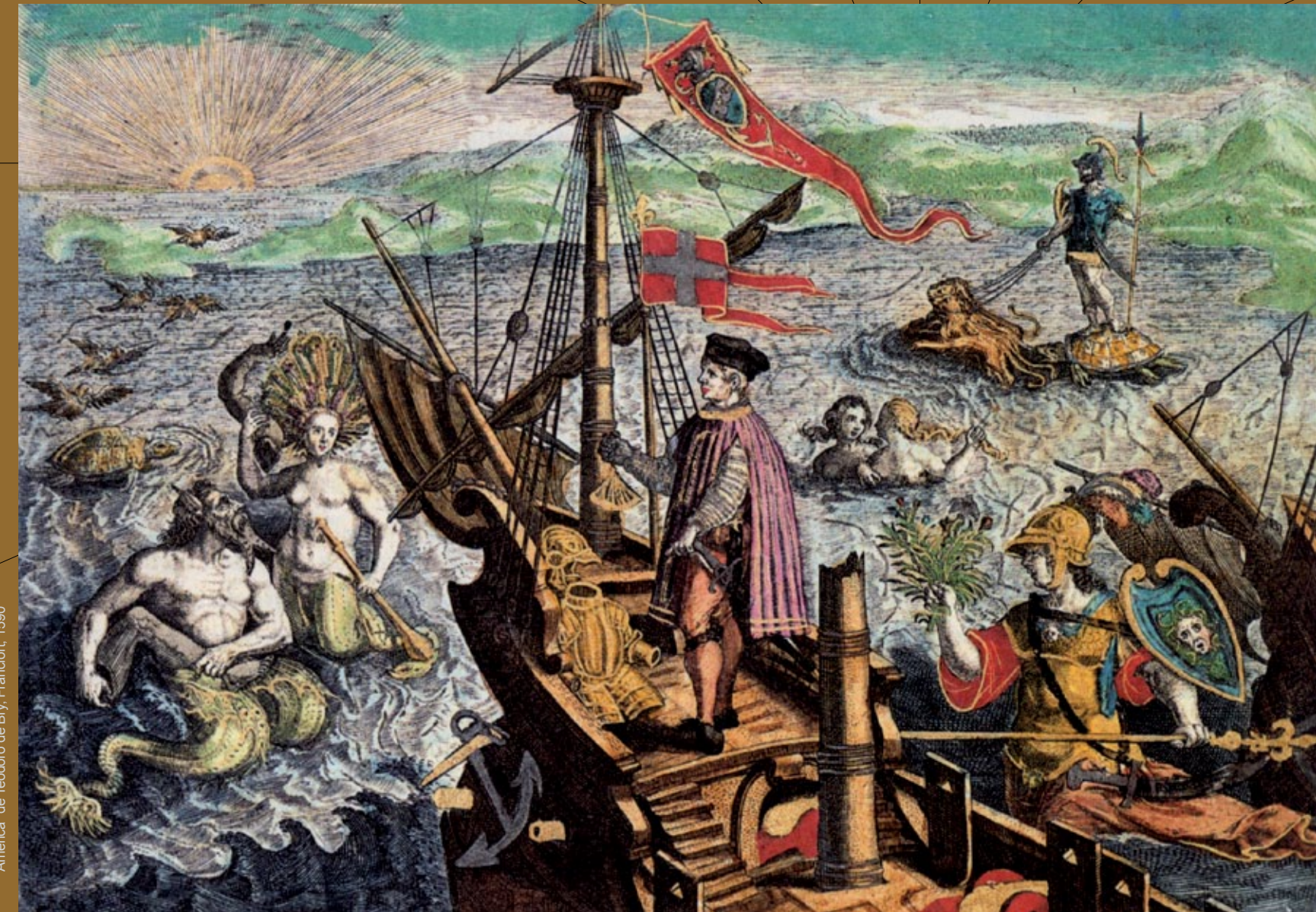
Alegoría de Colón "América" de Teodoro de Bry, Frandfort, 1590