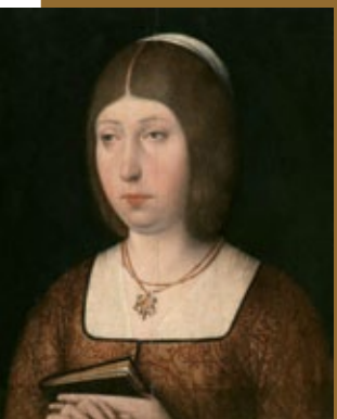
Isabel de Castilla, atribuido a Antonio Inglés, 1490, Museo Nacional del Prado, Madrid