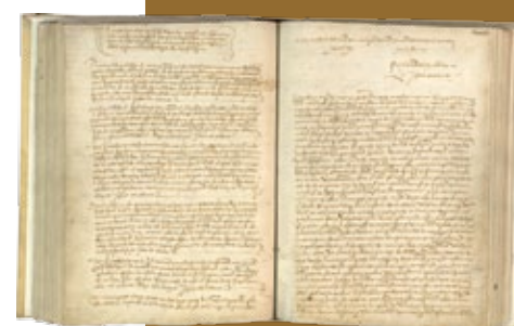
Capitulaciones de Santa Fe, 17 de abril de 1492, Archivo de la Corona de Aragón

Tales cálculos le parecieron concordar, aunque los conociera por medio de D'Ailly, con los de Alfragano (805-880), quien asignaba una longitud de seis millas y dos