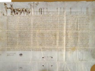
Bula Inter caetera, Papa Alejandro VI, 1493, Archivo General de Simancas