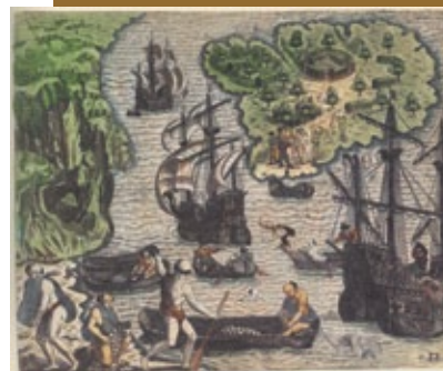
Isla de las Perlas "America" de Teodoro de Bry, Francfort, 1590