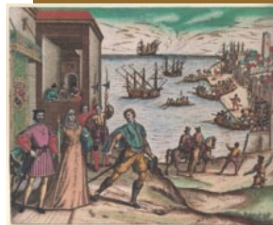
Colón se despide de los Reyes Católicos "America" de Teodoro de Bry, Francfort, 1590