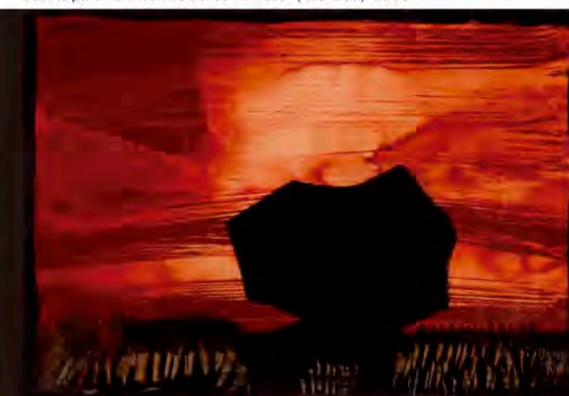
© Joaquín Vaquero Turcios (VEGAP, Granada, 2016) Boceto para "El Inocendio de los Pirineos" ( Atlántida ). 1963