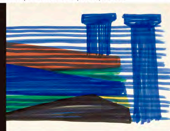
José María García de Paredes Boceto para "El Hundimiento" ( Atlántida ). Ca. 1963